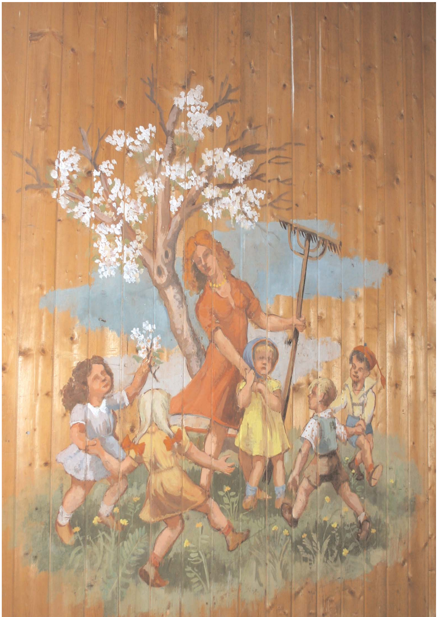
Barn og kone som venter på faren? Legg merke til at denne kvinnen i rødt er med på 3 av de 4 maleriene i dette rommet.