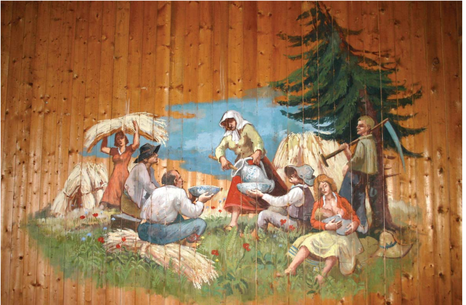
Spisepause for gårdsarbeidere.

Innenfor ligger et mindre rom. Også her har det vært ildsted. Muligens er dette snakk om en lesestue?