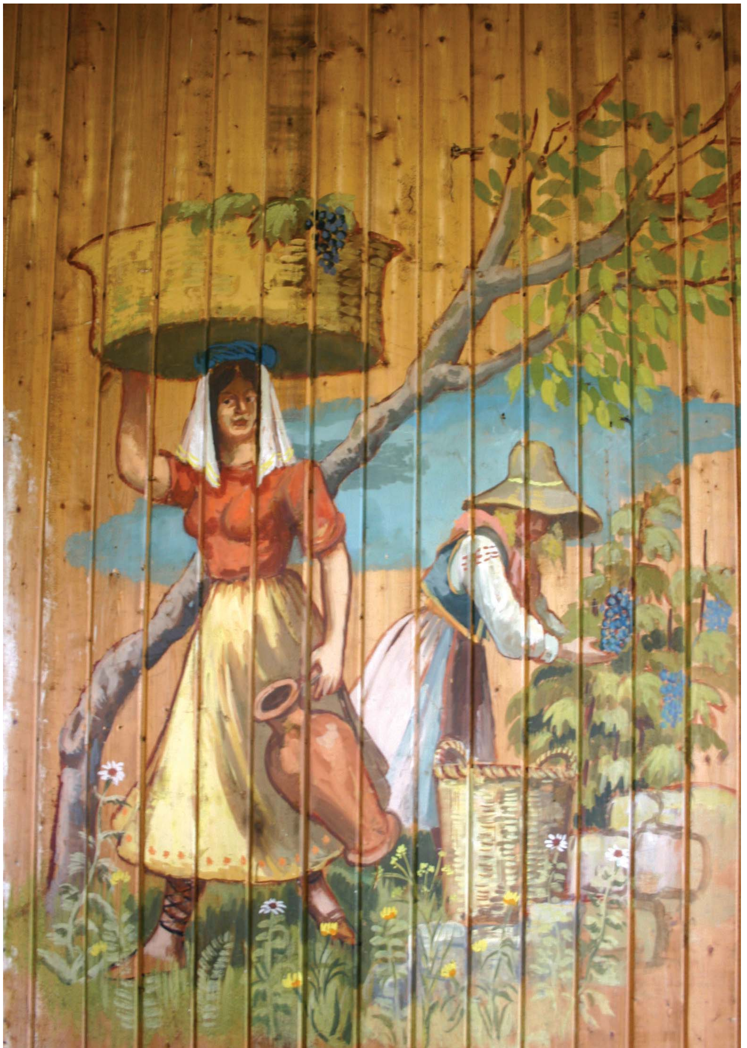
Plukking av vindruer