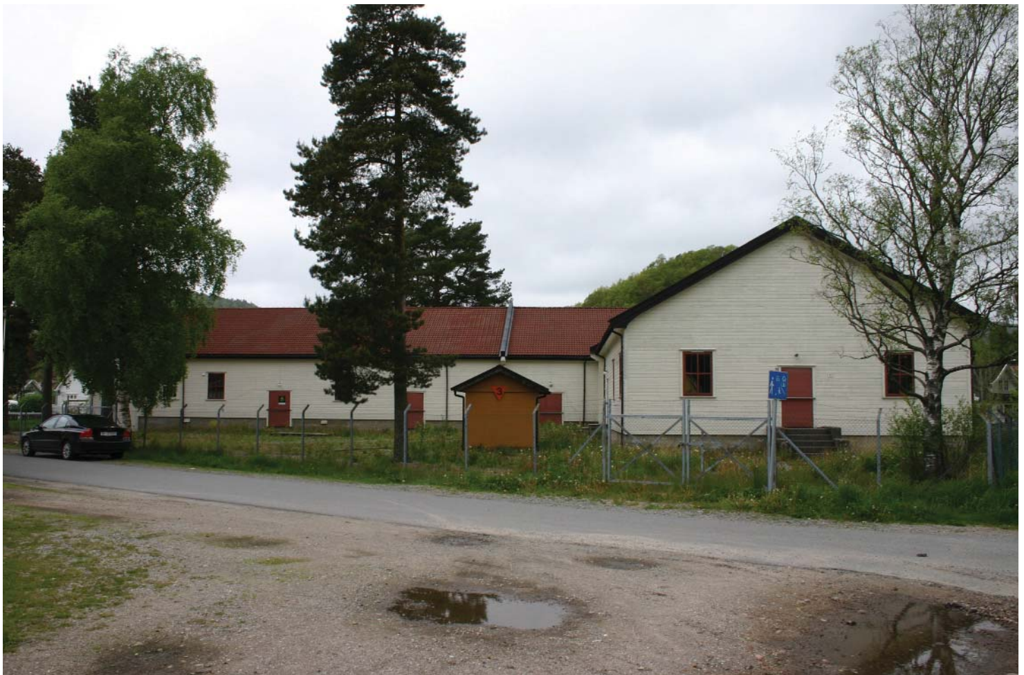
Kantinebygget slik det fremsto Sommeren 2005.

Tyskerne opererte ofte med mobile reservestyrker som kunne settes inn der hvor et eventuelt angrep ville komme. Disse styrkene var et tillegg til den stasjonære vaktstyrken langs kysten, og var normalt organisert som motoriserte infanteribataljoner. Oppsetninger av reservestyrker i Lyngdal startet like etter okkupasjonen var et faktum. Leiren på Skrumoen ble sannsynligvis etablert allerede i april 1940 under 214 Artilleri Regiment (under 214 Infanteri Div.), mens Rom dukket første gang opp på Britiske etterretningskart i mars 1943. I august 1943 ble 214 Infanteridivisjon erstattet med 274 Infanteridivisjon med hovedkvarter i Stavanger, men allerede etter ett års tid ble det bestemt at Divisjonsstaben skulle flyttes til Lyngdal. Det er rimelig å tro at forsvaret av Lyngdal ble betydelig forsterket forut for dette, og at de fleste av bygningene på Rom ble bygget i tidsrommet 1942-43. Fra 1943 viser både kart og feltpostlister et oppsving av infanteristyrker i tillegg til artilleriet. Stillingskart fra 1944 viser at Festningsinfanteri Regiment 862 har 3 infanterikompanier samt et panserjegerkompani stående i Lyngdal. På samme tid har 274 Divisjon 3 feltartilleri batterier i samme område, en betydelig mobil styrke.