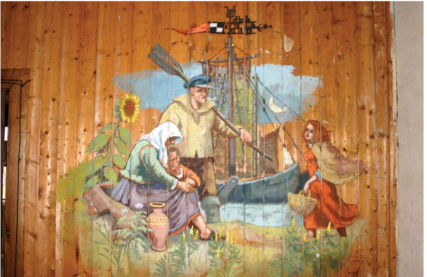
Fiskebåt av typisk nord Tysk type.