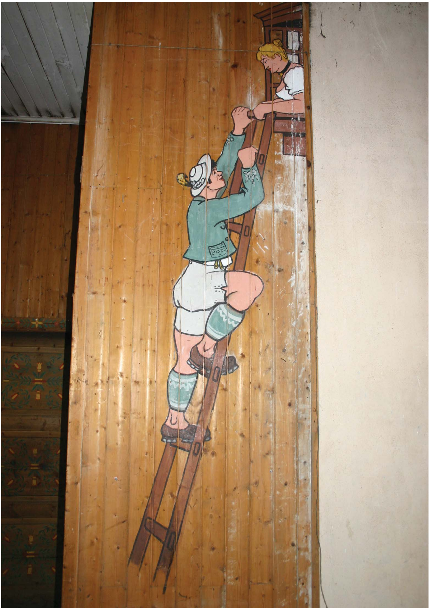
Frieri på Bavarisk vis, hvor mannen klatrer opp til kvinnens vindu, kjent som " Fensterln"